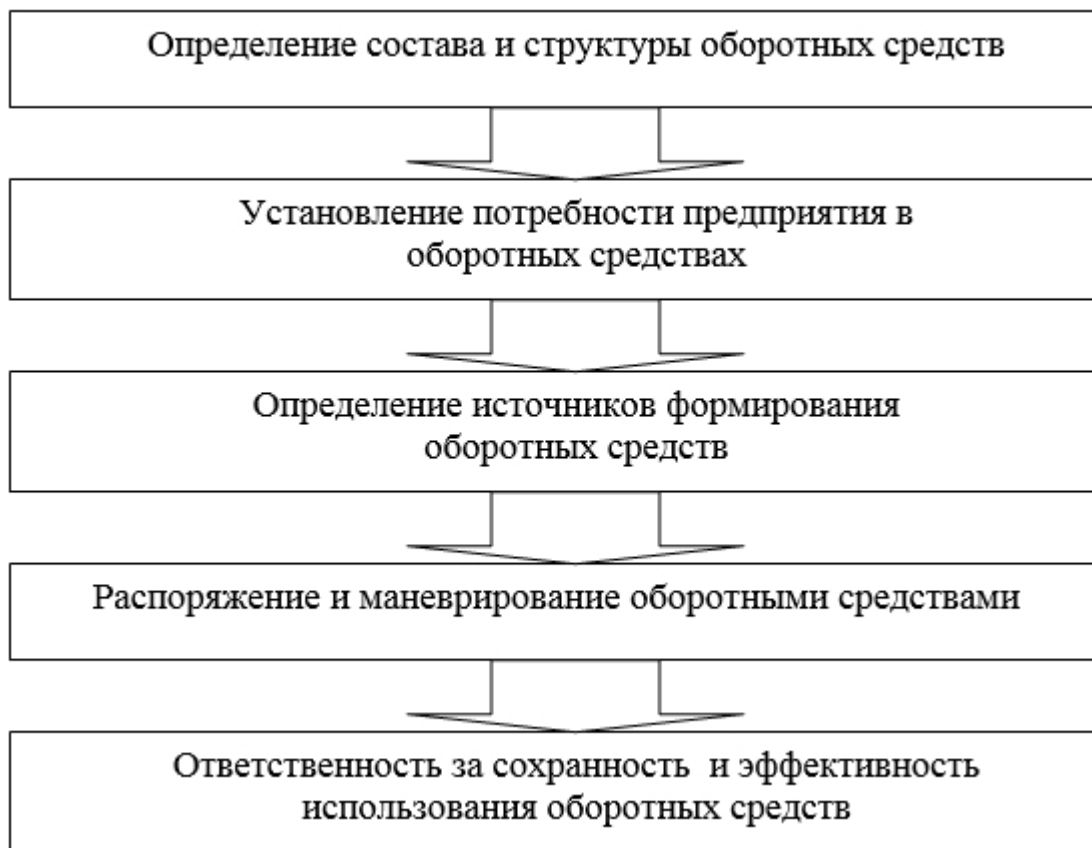
Рисунок 5 - Последовательность организации оборотных средств

Учитывая, что организация, управление и анализ оборотных активов являются фундаментальными в решении проблем подъема уровня эффективности их использования, оптимизации структуры источников их пополнения, считаем возможным графически представить организацию оборотных средств в виде следующей последовательности (рисунок 5). [20]