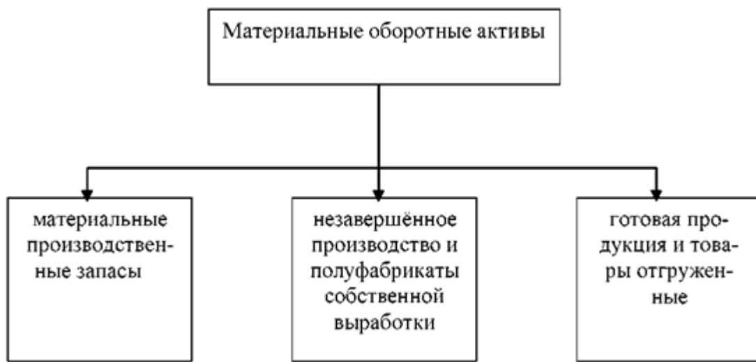
Рисунок 4 - Структура материальных оборотных активов

Наиболее сложными по составу и медленно оборачиваемыми являются материальные оборотные средства, структура которых представлена на рисунке 4.