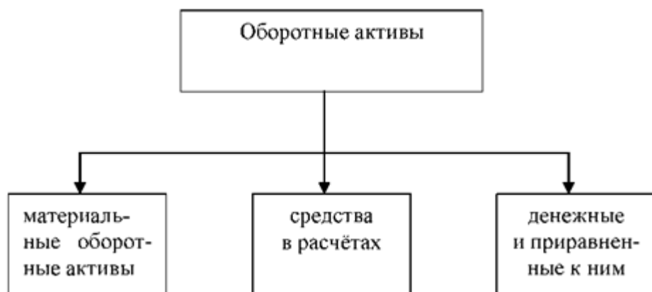
Рисунок 3 - Структура оборотных активов

средств является основой бесперебойного процесса производства и обращения. Профессор В.Ф.Палий предлагает структуру оборотных активов, которая представлена на рисунке 3. [7]